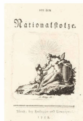
Johann Georg Zimmermann