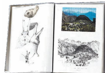
Album di schizzi di Hans Witschi

WITSCHI, Hans, Skizzenbuch 1985–1987 , 1 fascicolo, 1985–1987.