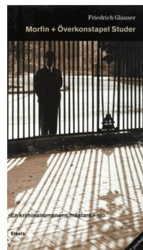
Wachtmeister Studer di Friedrich Glauser in svedese: Stoccolma, Ersatz, 2008, Sig. N 290626

L'introduzione della Gemeinsame Normdatei (GND) della Deutsche Nationalbibliothek costituisce un ulteriore passo in avanti nella standardizzazione. La GND riunisce le norme di catalogazione e viene introdotta nella primavera del 2012 per la catalogazione per soggetti. Si prevede di utilizzarla anche per la catalogazione alfabetica, ma questo genere di impiego necessita ancora di studi approfonditi. La GND sostituirà per esempio l' authority file dei soggetti, di cui la BN ha gestito a lungo l'unica redazione centrale svizzera (SWD-Clearingstelle).