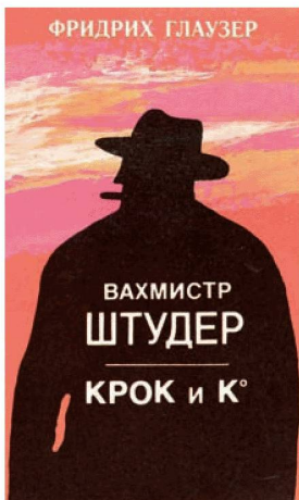
Wachtmeister Studer in russo: San Pietroburgo, Kult-inform-press, 1992, Sig. Nb 61124