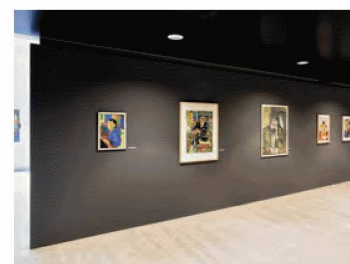
Panoramica della mostra Friedrich Dürrenmatt – Portraits et autoportraits (18.07.–16.09.2012)