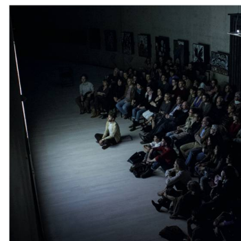
Notte dei musei presso il CDN, 18.5.2013