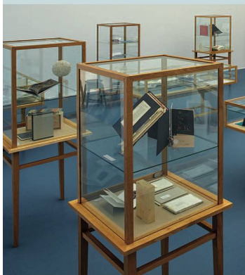
Unikum – Unikat, 22.11.2014– 28.2.2015