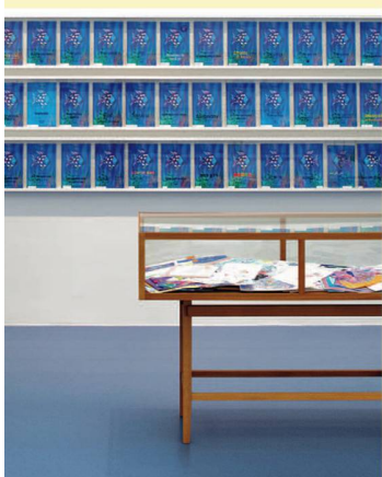
Il pesciolino Arcobaleno , mostra dedicata al libro di Marcus Pfister, 20.3.–27.6.2015

L'European RDA Interest Group (EURIG) collabora allo sviluppo delle nuove norme di catalogazione RDA 12 e al loro adeguamento ai criteri europei, affinché possano trovare applicazione anche in Europa. Nel 2015 la BN ha ospitato l'assemblea dei soci EURIG, alla quale hanno presenziato 27 delegati provenienti dal 18 Paesi.