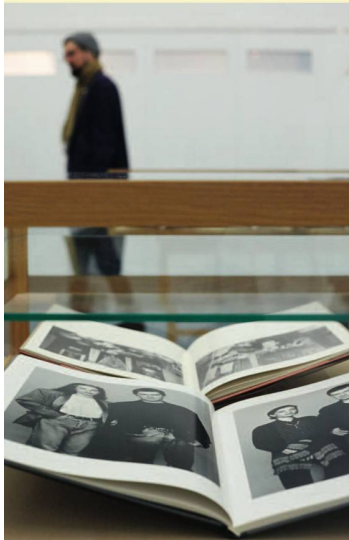
Il libro di fotografie e i suoi autori , 28.11.2015–13.2.2016

Dopo Unikat – Unicum , la mostra Il libro di fotografie e i suoi autori si è concentrata su un'altra forma dei libri d'artista. Sono stati esposti libri di fotografie di autori, fotografi ed editori svizzeri a partire dal 1990. Il 27 novembre il tema è stato discusso da esperti del mondo scientifico e della prassi nell'ambito di un convegno. Anche la mostra e il convegno di quest'anno son stati realizzati nel quadro del progetto finanziato dal Fondo nazionale svizzero per la ricerca scientifica «Gli artisti e i libri (1880–2015). La Svizzera come piattaforma culturale».