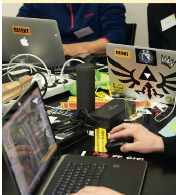
Hackathon della cultura, 27./28.2.2015