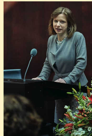
Christa Markwalder, vicepresidente del Consiglio nazionale, ha inaugurato l'assemblea annuale della CENL, 18.5.2015