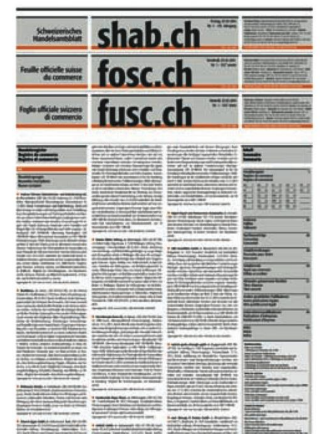
Schweizerisches Handelsamtsblatt, 1 (2014)