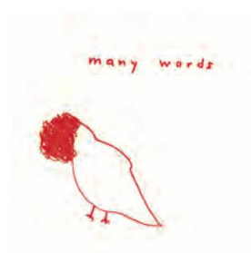
Peter Clemens Brand, many words , 2013, Edizioni Benjamin Dodell