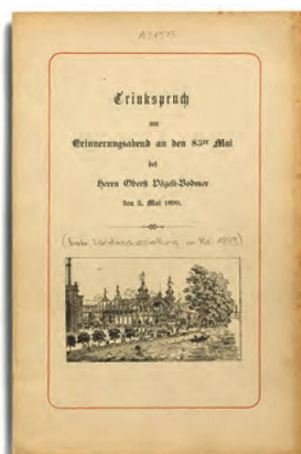
Hardmeyer, Jakob, Trinkspruch , 1890