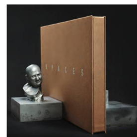
Urs Lüthi, reggilibro, 2011