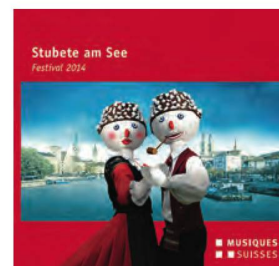
Stubete am See