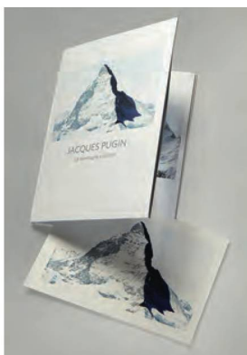
Pugin, Jacques, La montagne s'ombre , 2018