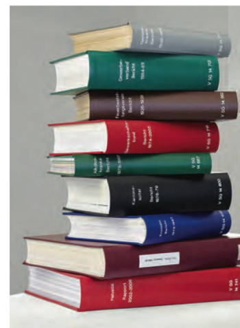
La BN rilega a fini conservativi la totalità delle opere ricevute