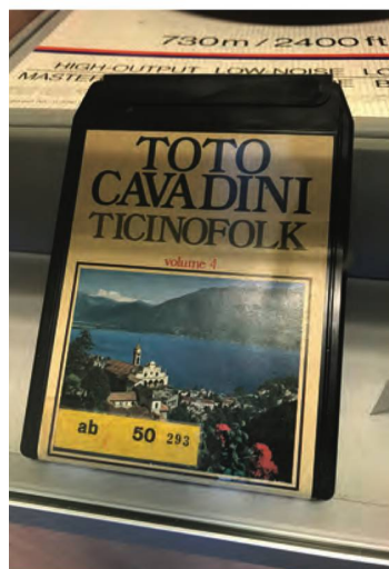
La Fonoteca colleziona anche supporti storici come gli Stereo-8