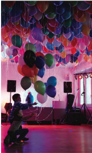
Alla Notte dei musei i bambini si sono divertiti a liberare in aria dei palloncini

Tre giornate di immersione totale in cui i «wikimediani» sono stati guidati alla scoperta della storia della registrazione e dei numerosi documenti sonori custoditi negli archivi della FN, preziosa testimonianza della nostra identità culturale. Un intenso e avvincente fine settimana in cui i membri di Wikimedia hanno scoperto il patrimonio sonoro salvaguardato dalla FN, attraverso presentazioni, visite guidate e conferenze di ospiti speciali.