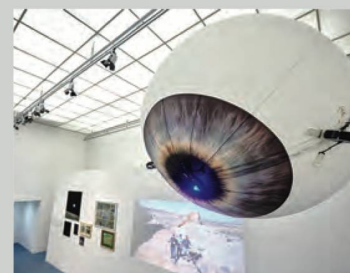
L'occhio del drone è costantemente puntato sulla mostra