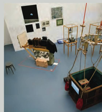
Vista dall'alto sullo spazio espositivo