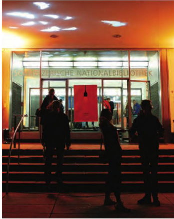
I nottambuli visitatori del museo davanti all'entrata della Biblioteca nazionale svizzera