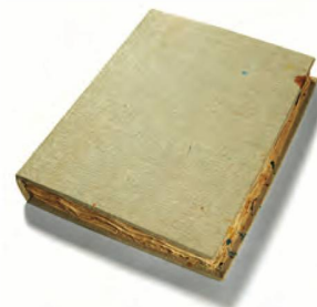
La discreta copertina del libro di Christoph Hauri Grosses Malbuch , libro d'artista, esemplare unico, 2003

16 scatti in bianco e nero di ghiacciai svizzeri in stampa vintage ai sali d'argento (2014–2016). Ed. n. 1/2 (2018/2019). Lavoro fotografico in serie basato sulle opere di Daniel Dollfuss-Ausset: collezione di 28 dagherrotipi che rappresentano le più antiche eliografie delle Alpi, riprodotti in fotografie e accompagnati da estratti dei materiali usati per lo studio dei ghiacciai avviato nel 1893.