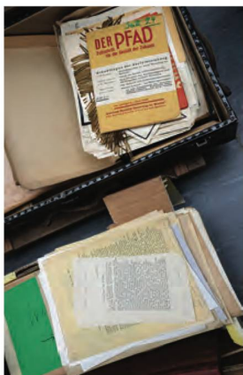
Uno sguardo all'interno della cassa del lascito Storrer