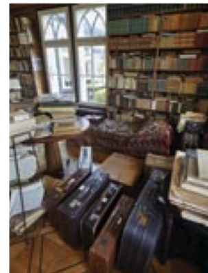
Biblioteca di Fränkel e valigie contenenti il lascito integrato di Spitteler

La chiusura delle sale di lettura imposta dalla pandemia ha fatto diminuire del 12% il numero dell'utenza attiva, che è passata da 943 (2019) a 829 (2020). Anche le richieste di informazioni e ricerche hanno segnato un calo (-17%) passando da 3949 (2019) a 3257 (2020).