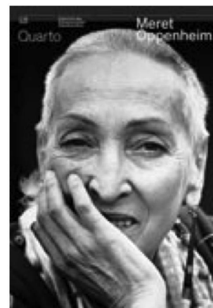
Quarto su Meret Oppenheim