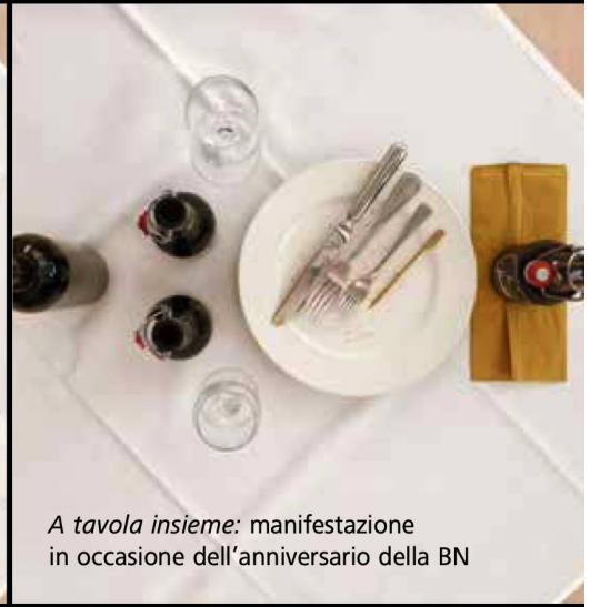
A tavola insieme: manifestazione in occasione dell'anniversario della BN