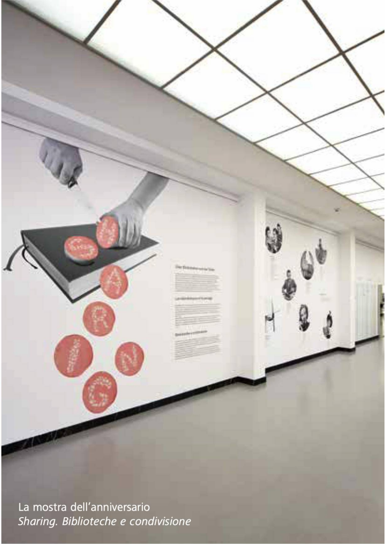
La mostra dell'anniversario Sharing. Biblioteche e condivisione