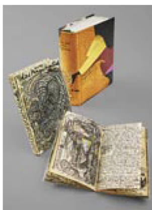
Bernhard Luginbühl: due diari (attorno al 1975 e al 1992) e Das Knochenlied