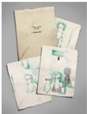
Fiorenza Bassetti: libro d'artista composto da dieci acquarelli e busta, ca. 1980