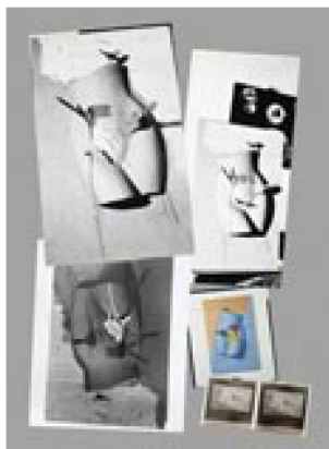
Daniel Spoerri: fotografie dell'assemblaggio Gebauchpinselt tratto dalla serie Pièges à mots (trappole per parole), ca. 1966

Nell'anno in rassegna, il Gabinetto delle stampe ha acquistato o ricevuto complessivamente una settantina di libri d'artista, edizioni ed edizioni limitate, tra cui un incarto rappresentativo di «libri illustrati» dall'artista lucernese Rolf Winnewisser (*1949) e due libri d'artista della zurighese Marlyse Brunner (*1946) realizzati in carta riciclata della Germania Est. Tra i nuovi arrivi, si annovera inoltre Dans le tunnel , pieghevole realizzato nel 2021 dall'artista franco-russo Serge Chamchinov e ispirato all'omonimo racconto di Friedrich Dürrenmatt. Il Gabinetto delle stampe ha ricevuto oltre 40 libri artistici della pittrice e scultrice ticinese Fiorenza Bassetti (*1948), prima parte di una voluminosa donazione che verrà arricchita prossimamente dai famosi ritratti fotografici dell'artista. La Collezione di manifesti è stata ampliata di oltre 1100 esemplari. Particolarmente degni di nota sono quelli realizzati dall'Ufficio federale della sanità pubblica per la campagna di lotta contro la pandemia di coronavirus, e quelli creati negli anni 2019/2020 dalle artiste e dagli artisti che hanno aderito all'iniziativa e al progetto di Hans-Ulrich Obrist ( It's urgent , LUMA project) volta