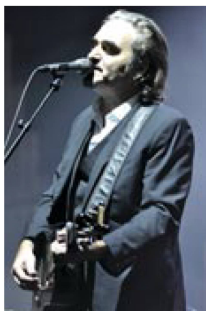
Stephan Eicher

Nel 2021 la Fonoteca ha valorizzato le proprie collezioni nell'ambito di varie collaborazioni: con il Centre Dürrenmatt Neuchâtel per la mostra permanente e per l'evento Dürrenmatt Sciascia 100 , tenutosi in occasione dei centenari di Friedrich Dürrenmatt e di Leonardo Sciascia; con la BN per le due mostre Carne – Una mostra sulla vita interiore e Al voto! Sul diritto ad avere una voce ; con la galleria Litar per la mostra Adelheid Duvanel Himmel ; e con la Fondazione Martin Bodmer per la mostra permanente. Ha inoltre partecipato a produzioni della SRF ( Internierung der Bourbaki-Armee in der Schweiz ) e della RTS ( Piero Coppola ) e a documentari del Film-Team di Uetendorf ( Das Reduit. Geschichte von 1939 bis 1945 ). Il 16 settembre 2021 la Fonoteca è stata inoltre ospite delle trasmissioni della RSI dedicate alla Giornata della musica svizzera .