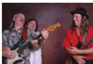
More Experience: cover band di Jimi Hendrix

La digitalizzazione delle registrazioni delle sedute del Consiglio comunale di Lugano dal 1962 al 2003 è frutto di un importante progetto di collaborazione. Nel 2021 la Fonoteca, insieme all'Archivio amministrativo della Città di Lugano e all'associazione Memoriav, ha lanciato un progetto per preservare e repertoriare tali registrazioni che prevede la digitalizzazione sull'arco di quattro anni di oltre 400 nastri magnetici conservati nell'Archivio amministrativo. Il pubblico può già ascoltarne alcuni collegandosi al catalogo digitale della Fonoteca e scoprire così un prezioso patrimonio storico che offre uno spaccato della storia e della vita politica della Città di Lugano.