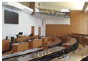
Sala del Consiglio comunale di Lugano

Anche nel 2021 la Fonoteca nazionale svizzera si è impegnata, insieme ad altre istituzioni, a favore della conservazione e della mediazione del patrimonio sonoro svizzero. In collaborazione con l'Archivio amministrativo della Città di Lugano e con l'associazione Memoriav ha lanciato un progetto teso a preservare le registrazioni delle sedute del Consiglio comunale di Lugano dal 1962 al 2003. Ha inoltre acquisito importanti collezioni come quella del gruppo svizzero More Experience e del Widder Bar di Zurigo. Infine, in occasione del centenario dalla nascita di Friedrich Dürrenmatt ha pubblicato una fonografia dedicata allo scrittore e pittore.