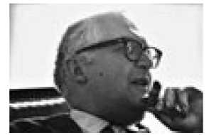
Friedrich Dürrenmatt

La Fonoteca ha ospitato il congresso annuale 2021 dell' Associazione internazionale degli archivi sonori e audiovisivi (IASA) per i paesi Germania e Svizzera, svoltosi online. La Fonoteca ha colto l'occasione per presentare l'istituzione e le sue attività a un pubblico di specialiste e specialisti e per rafforzare la propria rete. Il congresso è durato due giorni e ha visto la partecipazione di un centinaio di persone.