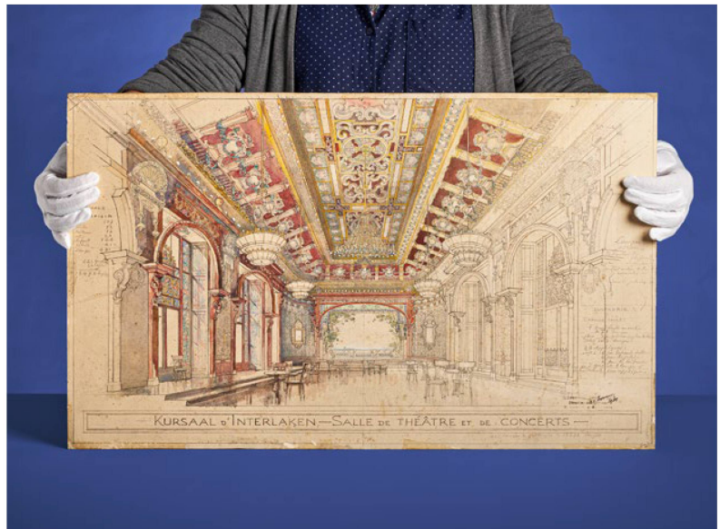
Paul Bouvier (1847–1940)

Nel 2022 il numero di domande di utilizzazione (745) è risultato leggermente inferiore a quello dell'anno precedente (2021: 775). Gli ambiti collezionistici più richiesti sono stati l'Archivio federale dei monumenti storici e la fotografia. Il numero di visitatrici e visitatori in loco ha superato quello dell'anno precedente, passando da 91 a 116. Sono stati prestati circa 80 documenti originali per dieci mostre. Digni di nota sono i prestiti di documenti fotografici storici per la mostra itinerante dedicata agli esordi della fotografia in Svizzera ( Dal Vero al MASI Lugano, D'après nature al Photo Elysée di Losanna), quelli di opere di Klein-