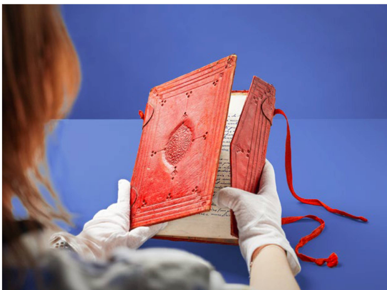
Isabelle Eberhardt Cartella proveniente dalla collezione Isabelle Eberhardt

La corrispondenza tra il critico belga di lingua francese Georges Poulet e Jean-Pierre Richard è stata pubblicata da Éditions Slatkine. Il carteggio, diffuso dall'ASL nel 2022, copre un periodo di quasi