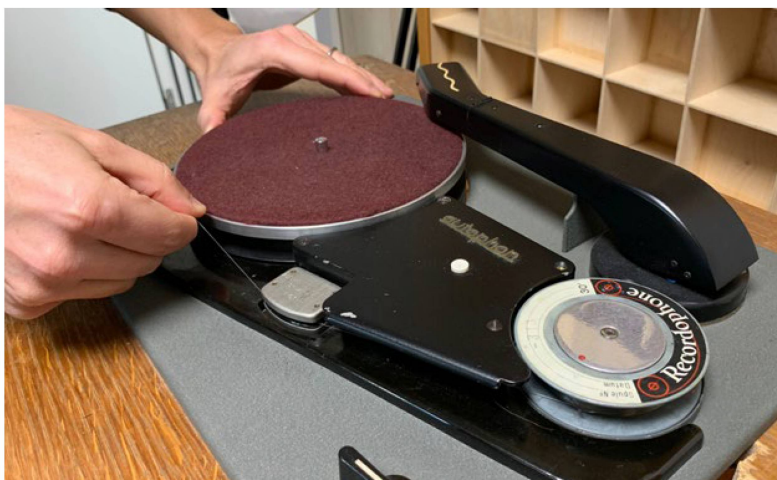
La macchina sonora del mese

I «Recordophone» di fine anni Quaranta della ditta Autophon AG