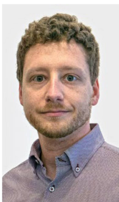
Raphaël Scacchi Autore del romanzo Arancione vendemmia