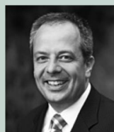
Rafael Enzler Produzioni marketing, Gestione dei marchi & Partenariati Strategici