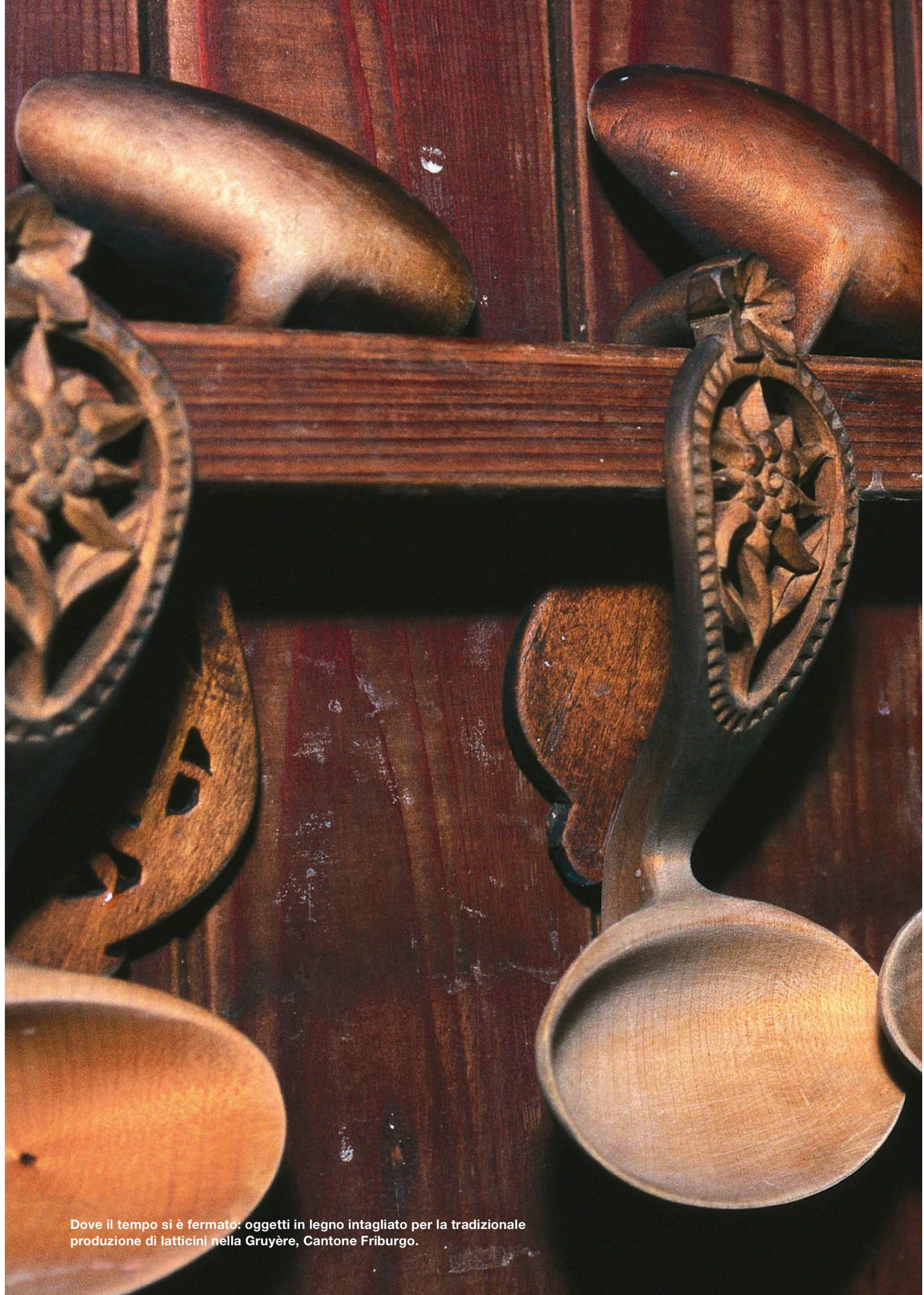
Dove il tempo si è fermato: oggetti in legno intagliato per la tradizionale produzione di latticini nella Gruyère, Cantone Friburgo.