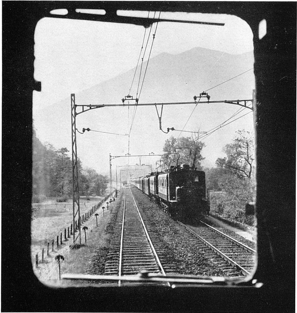
Vue de la cabine du mécanicien sur un train venant en sens inverse