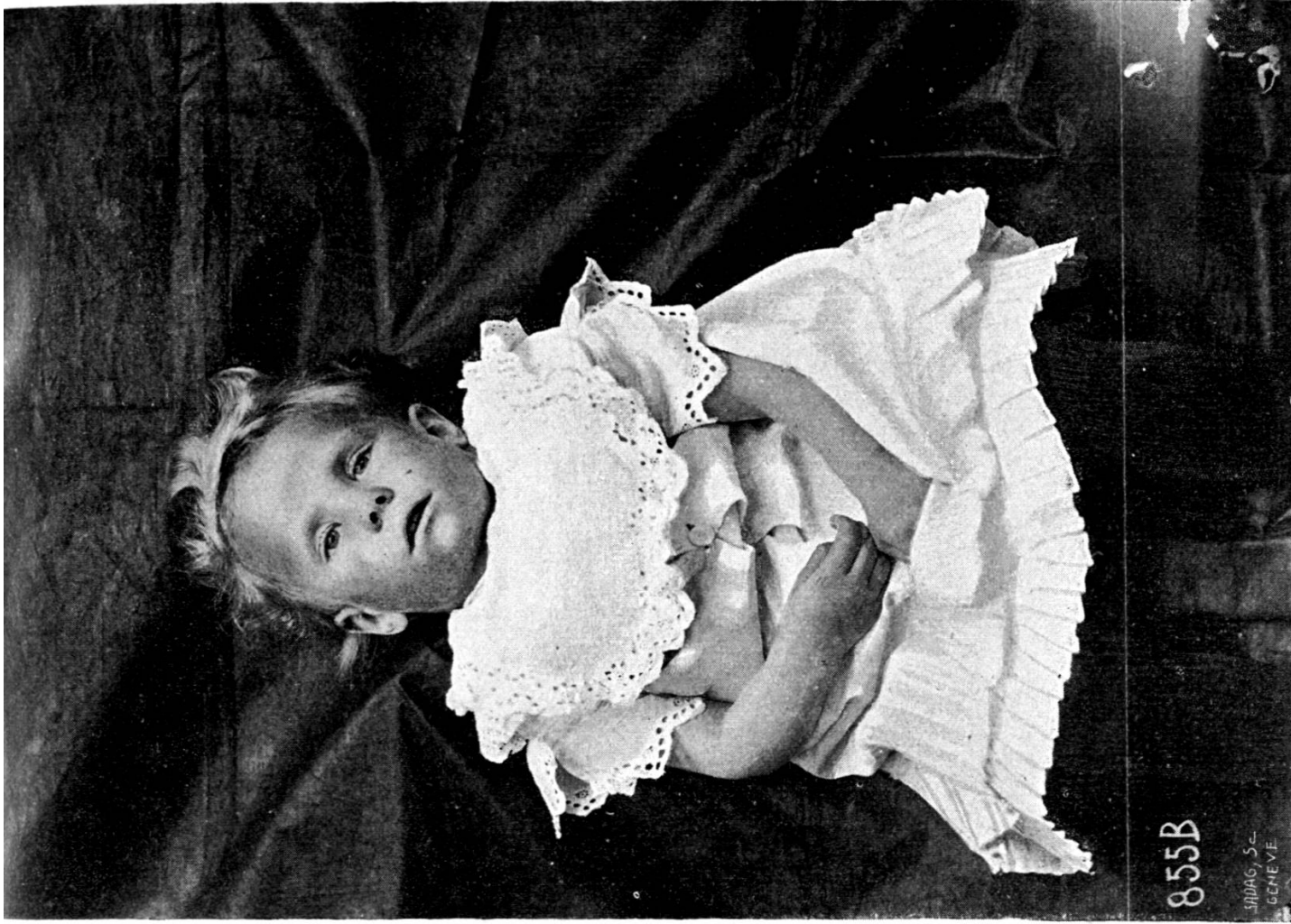
Similigravure : S. A. D. A. G., Genève.