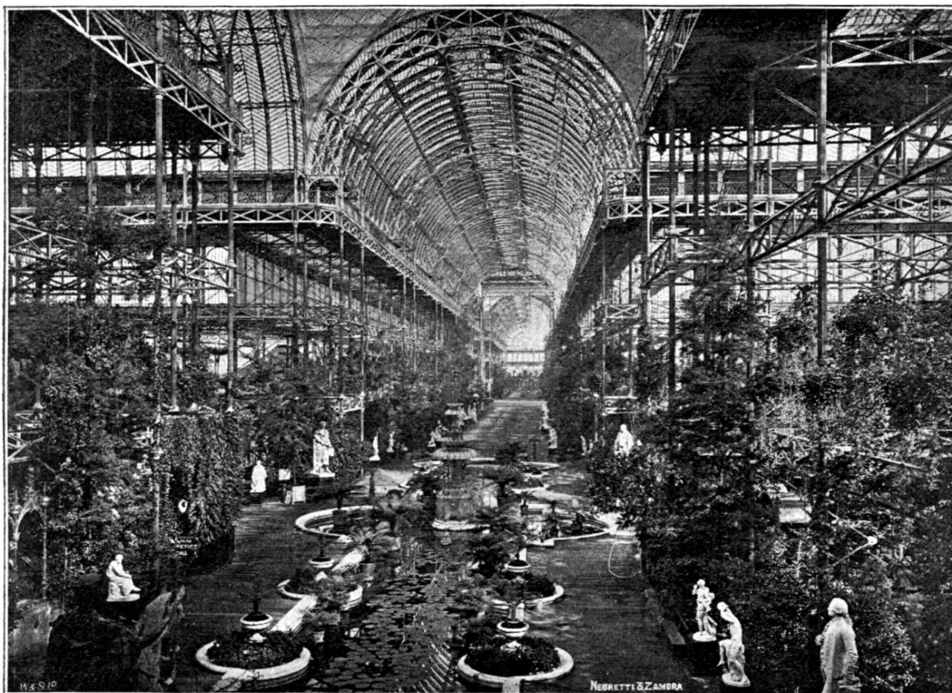
Phototype Negretti et Zambra.

Tous les exposants des Sections 3, 4 et 5, ainsi que ceux des autres sections] qui n'auront pas été invités d'une manière spécifique par le Comité à prêter des objets pour exposer, devront payer comme suit :