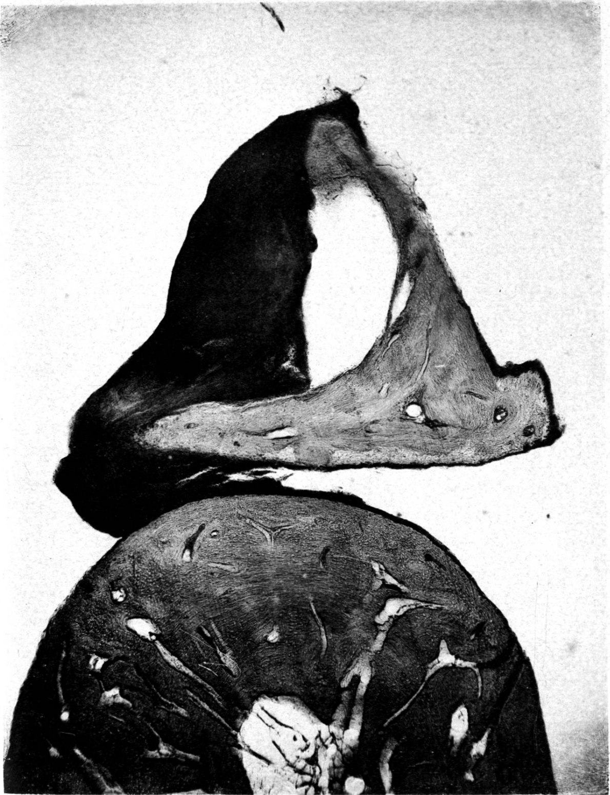
Photomicrographie et photocollographie de M. H. Speiser, à Bâle.

Détails pathologiques des osselets de l'oreille moyenne.