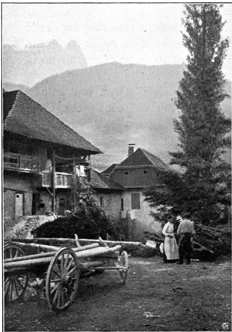
Phot. S. Minner, Genève. (Maison Füsli-Rigaud.)