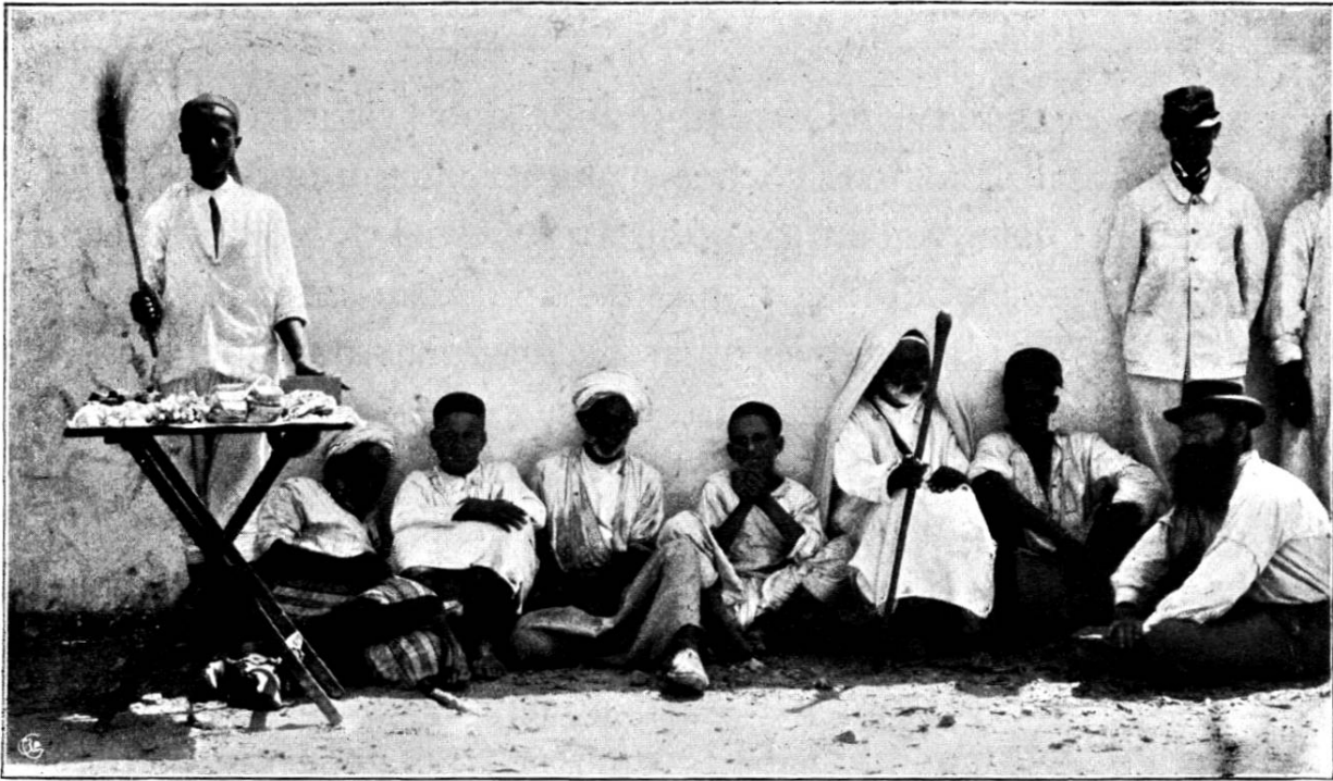
Gens de Tunisie.