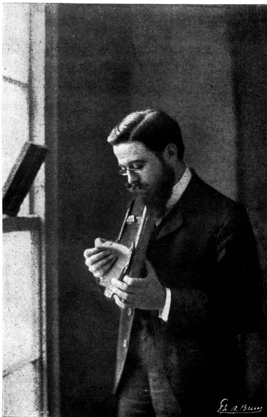
Cela tire! Phot. Ph.-A. Brun. Genève. (Gomme bichromatée).

II. Action de l'huile de térébenthine. — Expérience I : Le fond du récipient est couvert d'huile de térébenthine.