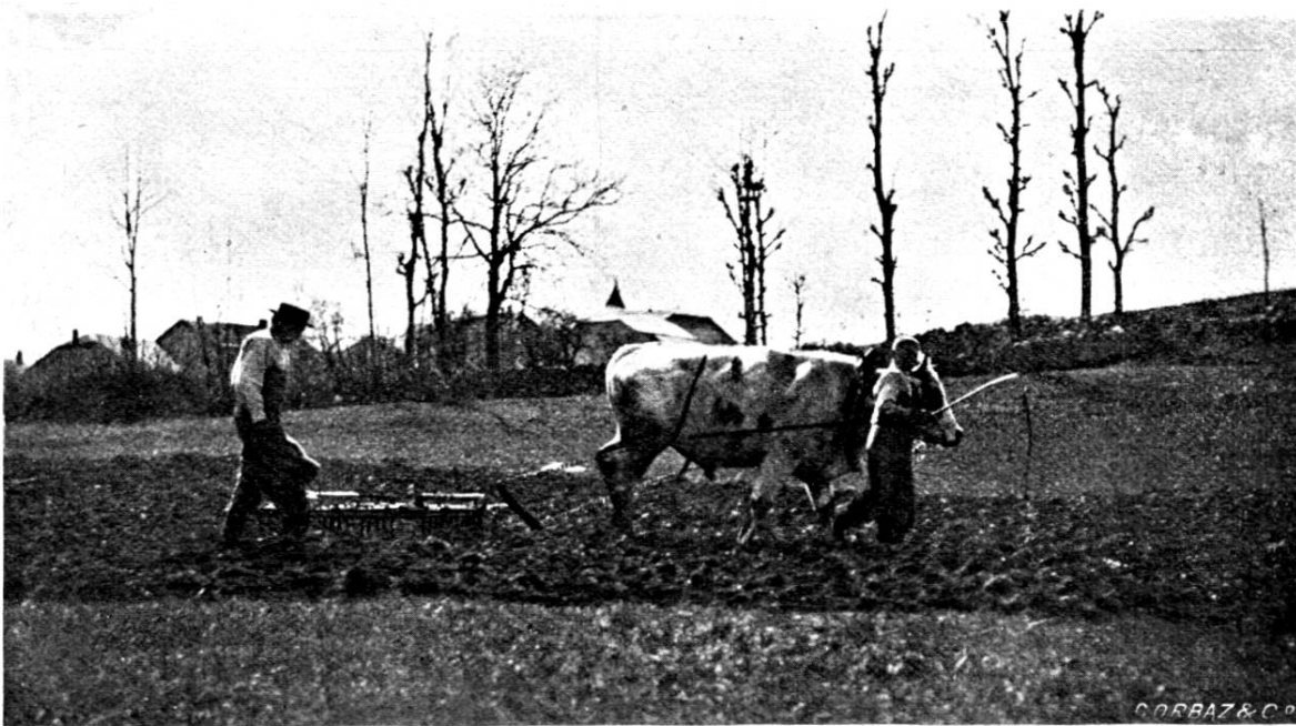
La Herse 1 .