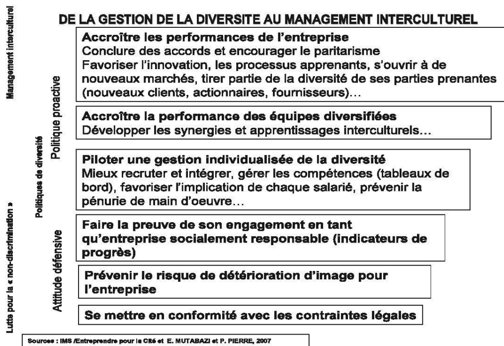
Schéma : De la gestion de la diversité au management interculturel

L'analyse locale des cultures n'est pas suffisante pour comprendre, par exemple, l'entreprise mondialisée. Celle doit prendre en compte les logiques de flux, d'enchevêtrement des identités culturelles. Que fait-on quand l'exception, celle des cadres internationaux, ne confirme pas la règle culturelle (leur appartenance nationale) et qui devrait, en toute logique, expliquer ou permettre de prédire leurs attitudes et comportements au travail ? Le management interculturel, dans son ambition, n'est pas un « contrôle » d'identité en donnant un avantage concurrentiel à un critère d'appartenance à un groupe plutôt qu'un autre. Il est une politique qui permet de construire les conditions d'accès à la reconnaissance en entreprise.