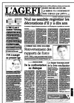
Lu - Ve Kiosque / Abonnement

Retrouvez l'intégralité de nos contenus sur www.agefi.com