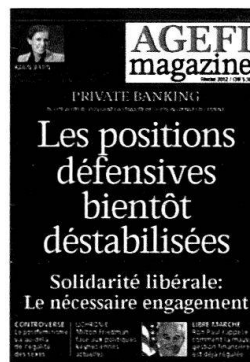
6 parutions Kiosque / Abonnement