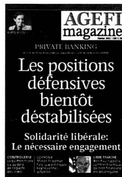
6 parutions Kiosque / Abonnement