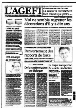
Lu - Ve Kiosque / Abonnement

Retrouvez l'intégralité de nos contenus sur www.agefi.com