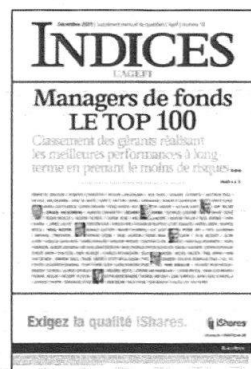
Mensuel Encarté dans L'Agefi