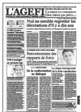
Lu - Ve Kiosque / Abonnement

Retrouvez l'intégralité de nos contenus sur www.agefi.com