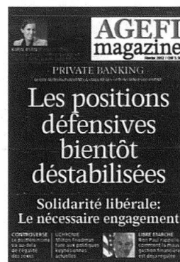
6 parutions Kiosque / Abonnement