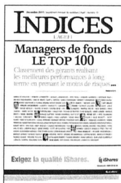
Mensuel Encarté dans L'Agefi