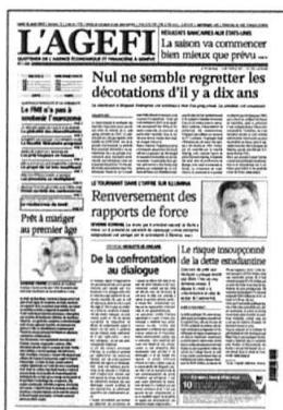
Lu - Ve Kiosque / Abonnement

Retrouvez l'intégralité de nos contenus sur www.agefi.com