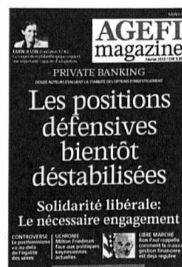
6 parutions Kiosque / Abonnement