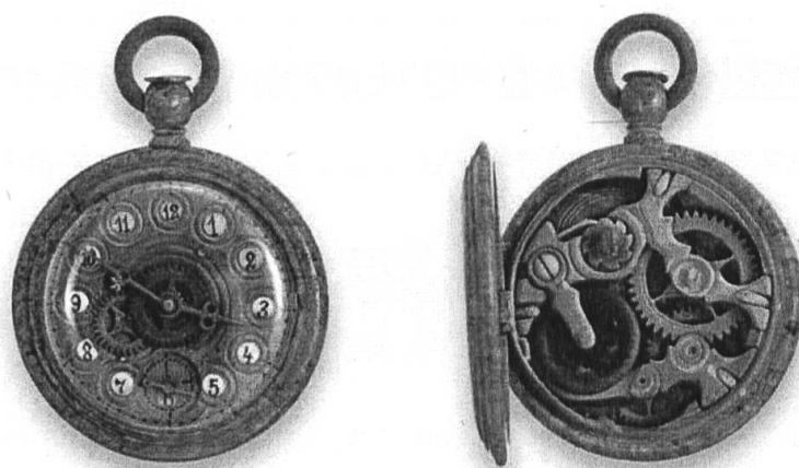
Figure 1: La montre en bois des Bronnikov.

A la fin du XIXème siècle, dans des villes russes différentes, travaillaient quelques centaines d'horlogers ayant leurs propres ateliers (frères Butenope à Moscou, Nikolai Tchijov à Saint-Pétersbourg, Ivan Kulibin à Nijni-Novgorod, la famille des Bronnikov à Viatka).