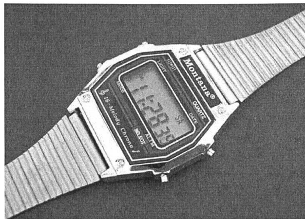
Figure 4: La montre multifonctionnelle «Montana» avec 16 sonneries.

Il faudrait, quand même, dire qu'en URSS, il y avait une montre dont rêvaient beaucoup de gens. Considérée comme étalon de qualité et de fiabilité, c'était la montre légendaire appelée «Commandant» qui était fabriquée pour la commanderie du Ministère de la défense à l'usine Vostok de Chistopol et qui n'était pas commercialisée. Les rares détenteurs de cette montre, l'ayant reçu par besoin de service, les transmettaient soigneusement aux héritiers. Posséder cette montre causait toujours de la jalousie dans l'entourage. C'est grâce à cela que la montre «Commandant» est connue mondialement.