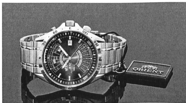
Figure 3: La montre Orient avec le calendrier perpétuel.

Dans les années 1970 ou 1980, les montres que possédait un homme russe étaient très souvent des montres japonaises ramenées des missions à l'étranger par des marins de la flotte marchande soviétique. Ces derniers avaient la possibilité d'acquérir ces montres soit pour eux-mêmes, soit, le plus souvent, pour la revente en Russie à un prix plus élevé. C'est notamment la montre Orient, le modèle avec un calendrier « éternel » qui est devenue l'icône horloger et le rêve absolu du soviétique de ce temps-là.