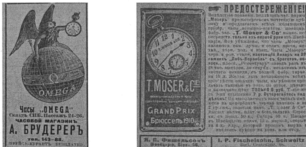
Figure 2: Annonces des marques horlogères en Russie – début du XXème siècle.

A cette époque les sociétés suisses très connues, telles que Tissot, Omega, Zenith, Doxa, Breguet, commencent leur expansion sur le marché russe; elles trouvent une bonne demande nationale en commercialisant leurs produits non seulement dans de grandes villes, mais aussi via la voie postale et couvrent tout le territoire de la Russie.