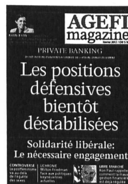
6 parutions Kiosque / Abonnement