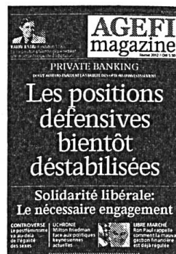
6 parutions Kiosque / Abonnement