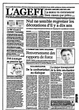
Lu - Ve Kiosque / Abonnement

Retrouvez l'intégralité de nos contenus sur www.agefi.com