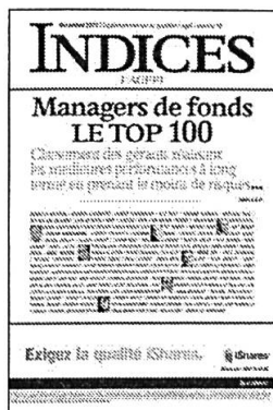
Mensuel Encarté dans L'Agefi