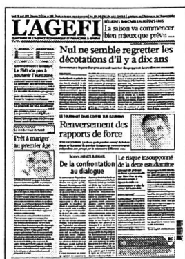
Lu - Ve Kiosque / Abonnement

Retrouvez l'intégralité de nos contenus sur www.agefi.com