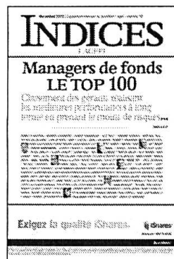
Mensuel Encarté dans L'Agefi