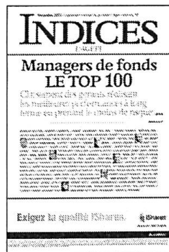
Mensuel Encarté dans L'Agefi