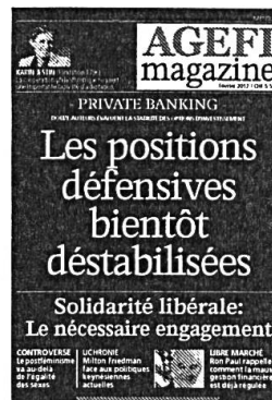
6 parutions Kiosque / Abonnement