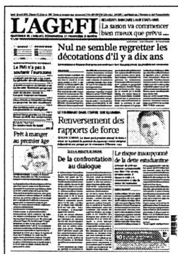
Lu - Ve Kiosque / Abonnement

Retrouvez l'intégralité de nos contenus sur www.agefi.com