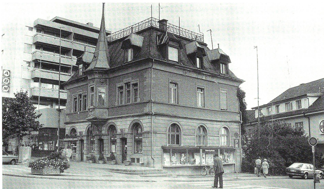
Von mittlerweile schon morschen Visieren umgeben — die Löwenapotheke an der Bahnhofstrasse.

«Wir finden es jammerschade, dass die Löwenapotheke abgebrochen werden soll. Bei diesem Gebäude handelt es sich um eines der bemerkenswertesten Häuser ausserhalb der Altstadtzone. Das Haus ist ein Werk des berühmten Architekten August Hardegger, der in der Schweiz um die Jahrhundertwende zahlreiche neugotische Kirchen schuf. Auch das Schiff der St. Peterskirche Wil wurde von ihm erbaut.» Gruber zweifelt auch an der fachlichen Kompetenz der St. Galler Regierung. Entscheide über die Schutzwürdigkeit eines Gebäudes in letzter Instanz zu fällen. Ausserdem befürchtet er, dass das Beispiel Löwenapotheke Schule machen könnte: «Es gibt noch andere Bauten, die der Gemeinderat ursprünglich im Schutzplan aufgeführt hat, die nun aber doch zum Abbruch freigegeben werden sollen.»