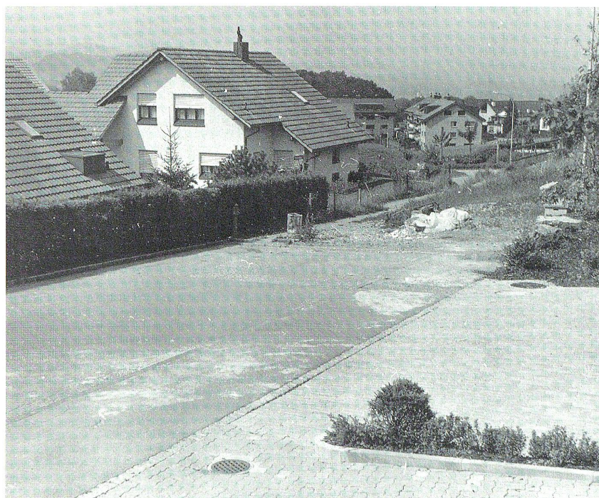
Zankapfel Höhenstrasse — hier scheiden sich die Geister.