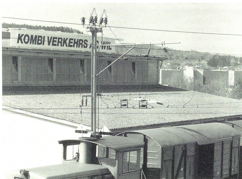
Die Kombi-Verkehrs-AG an der Hubstrasse.