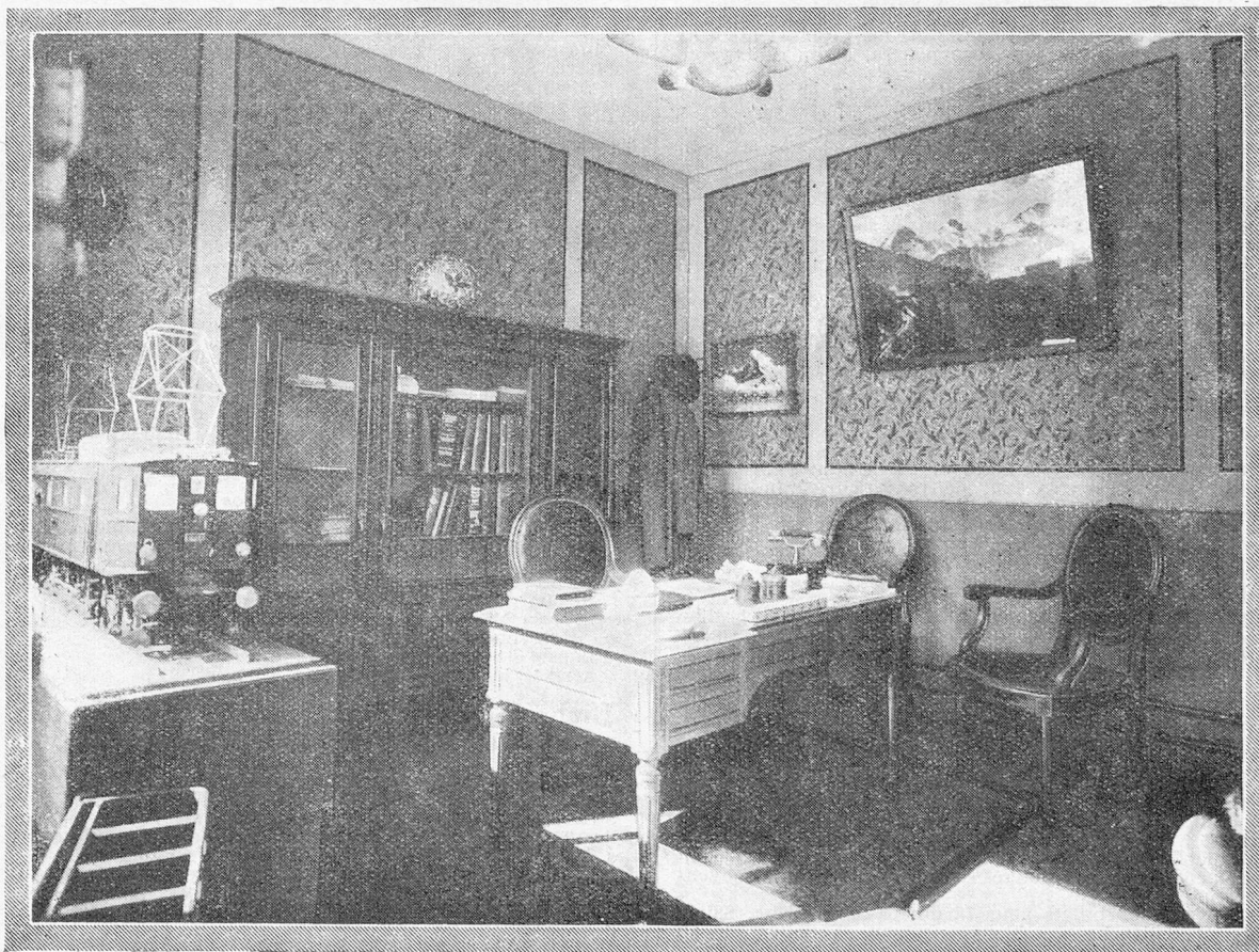
Un coin du bureau officiel suisse de renseignements à la Foire de Lyon, 1927

à Paris : Chambre de Commerce suisse en France.