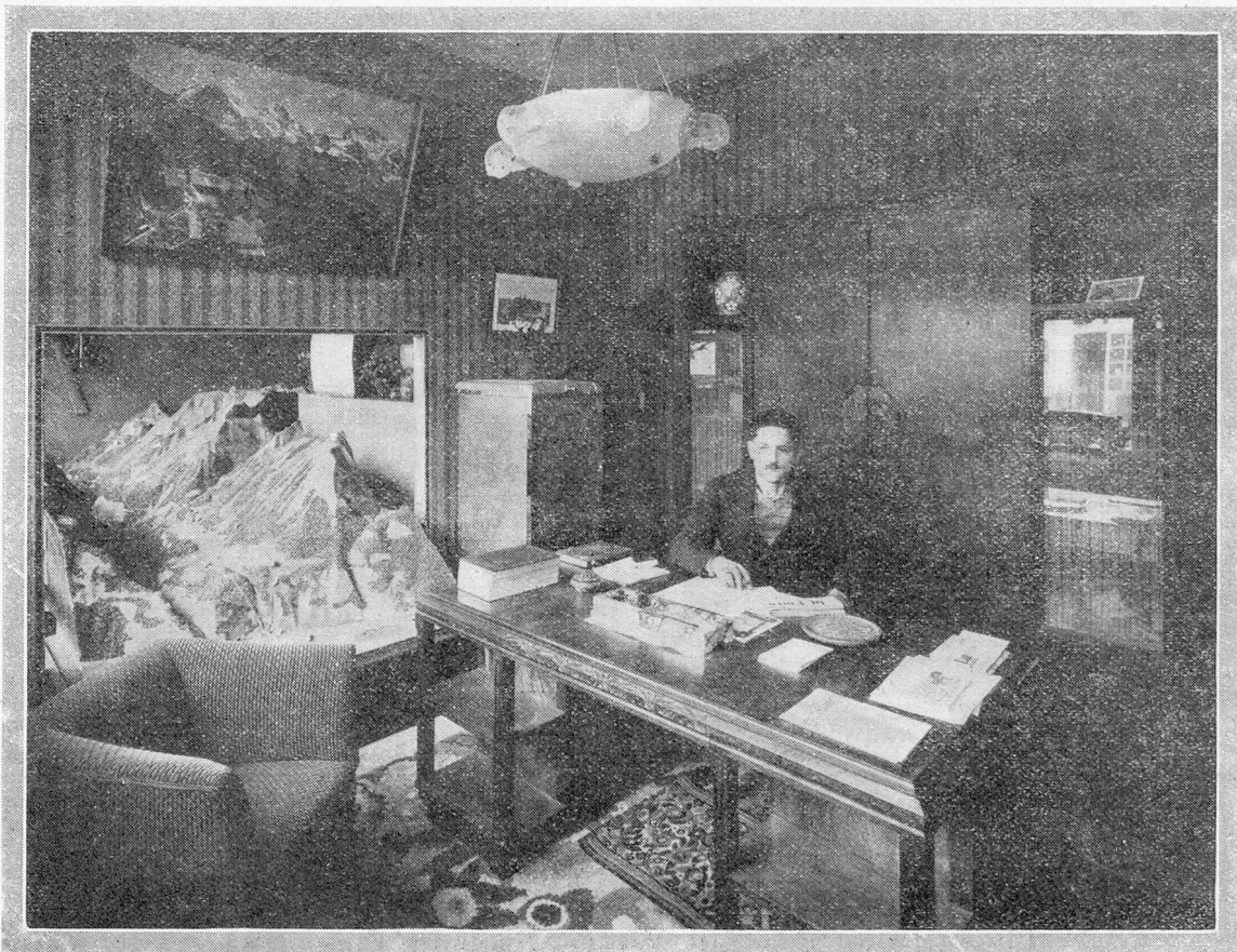
Le Bureau officiel suisse de renseignements à la Foire de Lyon.

Un déjeuner mensuel qui a lieu le premier samedi de chaque mois, à 12 h. 30, au Café Neuf, place Bellecour, réunit les membres de la section lyonnaise de la Chambre de Commerce suisse en France. Tous les membres et amis de notre Chambre de Commerce qui se trouveraient de passage à Lyon, le premier samedi du mois, sont cordialement invités à participer à ce déjeuner.