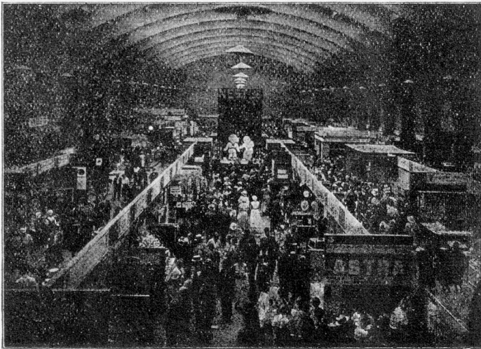
Une halle d'exposition.

GRANDE MANIFESTATION ÉCONOMIQUE D'AUTOMNE