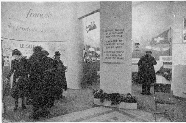
Stand Suisse à la Foire de Lyon : partie économique

lyonnaise; ses préoccupations ont été, et sont celles de tous ceux qui fabriquent et vendent, de tous ceux qui exportent ou s'efforcent de le faire.