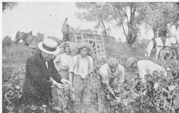
Cueillette d'aramon près d'Arles

Nous mentionnerons, en outre, les industries qui sont spécialisées dans la fabrication du matériel moderne complet de vinification des vins. Ces constructeurs, en contact permanent avec les propriétaires de vignobles, ont pu créer, surveiller en plein fonctionnement et progressivement perfectionner les outils qui, à l'heure actuelle, sont répandus dans toute les régions viticoles du monde où ils sont très appréciés pour