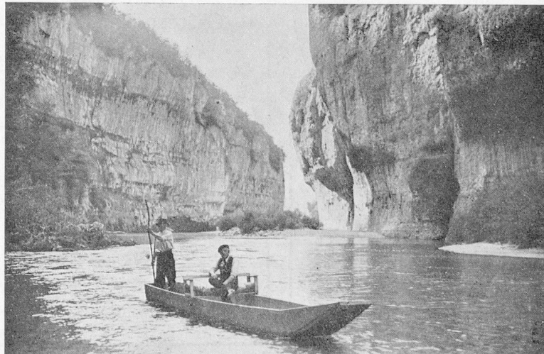
Gorges du Tarn, les Détrôits