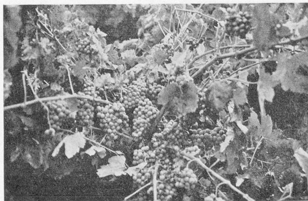
Un cep abondant

Ce territoire s'incline vers la mer, toutes les vallées y conduisent, tous les chemins descendent des montagnes, viennent rejoindre la