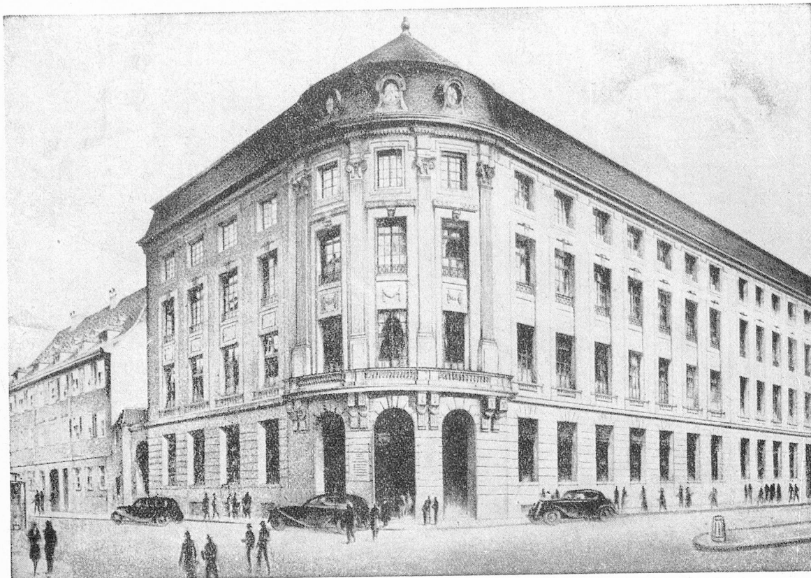
HOTEL DE LA BANQUE A BALE