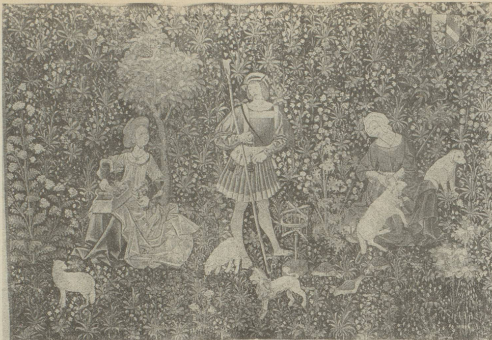
Le travail de la laine Tapisserie à fond de fleurettes des Ateliers des bords de la Loire, début xvi e siècle (Ancienne collection Larcade.)