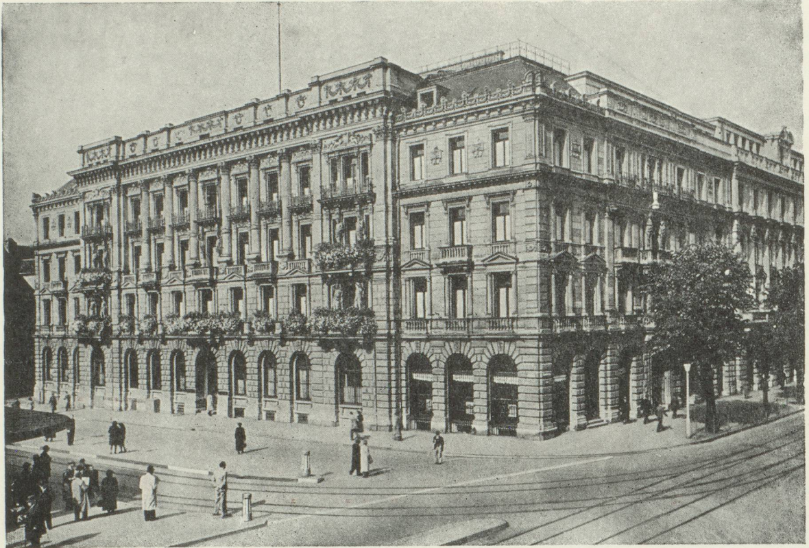
Hôtel de la Banque à Zurich