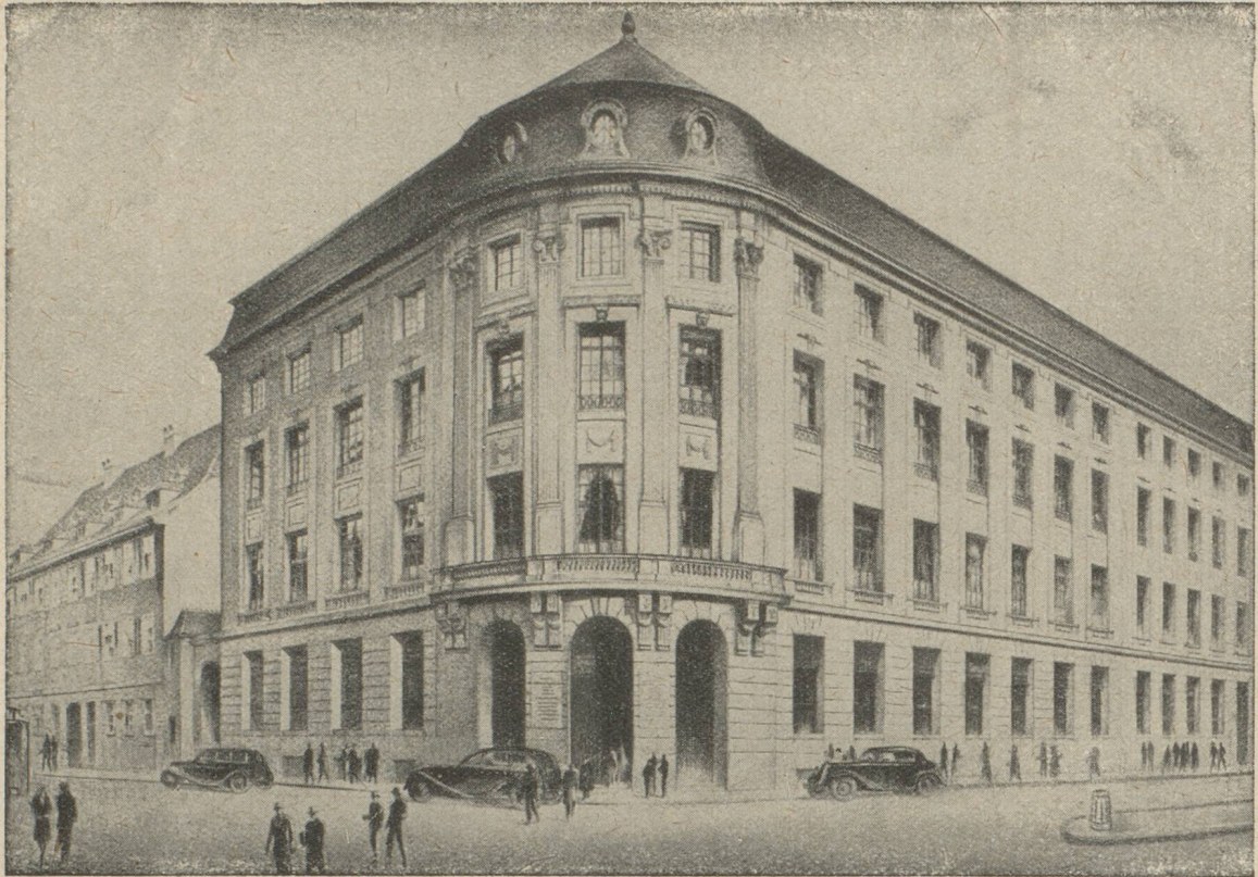
HOTEL DE LA BANQUE A BALE